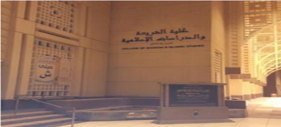
مؤشر الأداء KPI-P-09